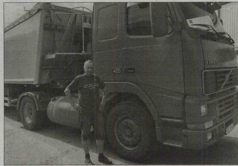
VARAKĻĀNOS – z/s «MELDRI»