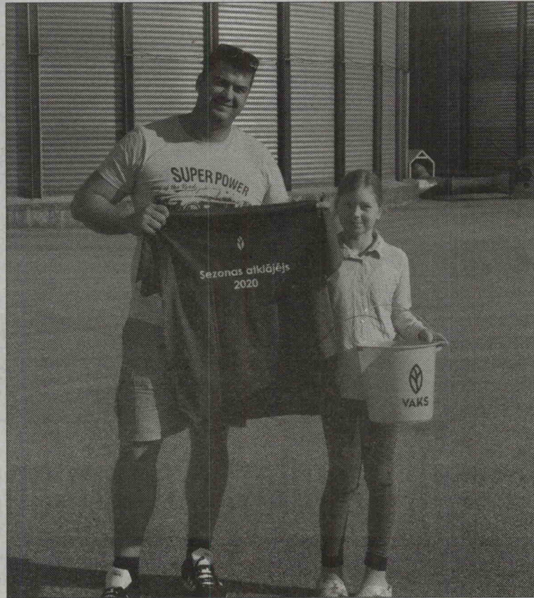
VALMIERĀ – SIA «RLS»