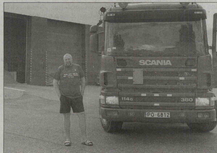
VALMIERĀ SĒKLU FABRIKĀ – SIA «Dēmetra».